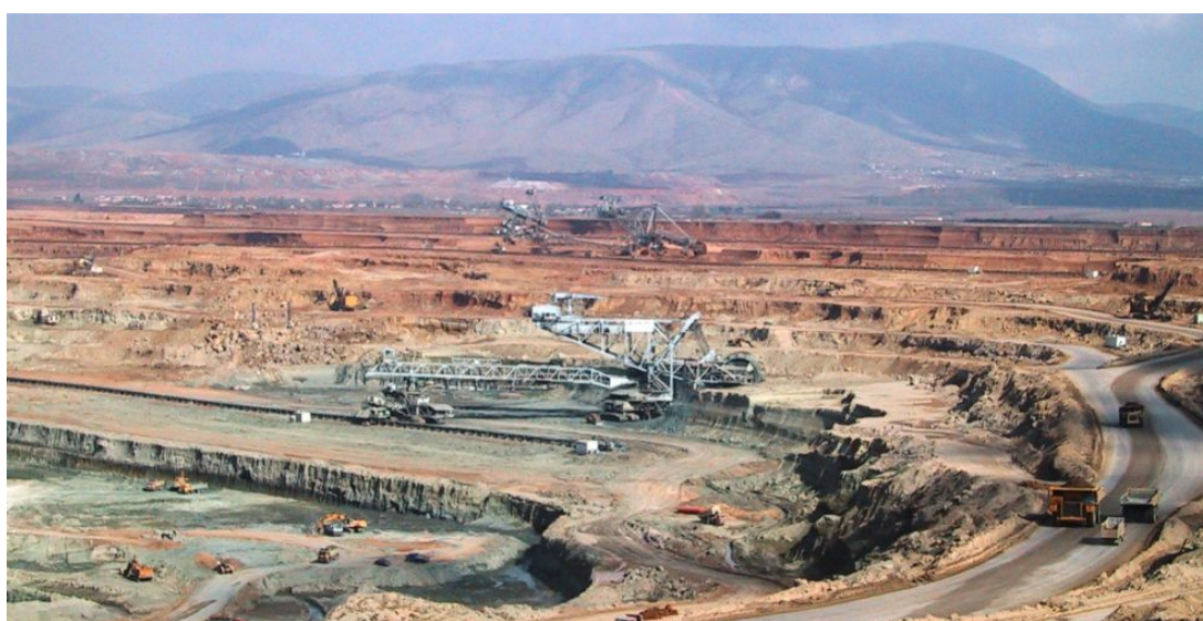
Λιγνιτωρυχείο στη Δ. Μακεδονία