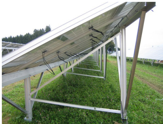
Τυπικό παράδειγμα φωτοβολταϊκού πάρκου