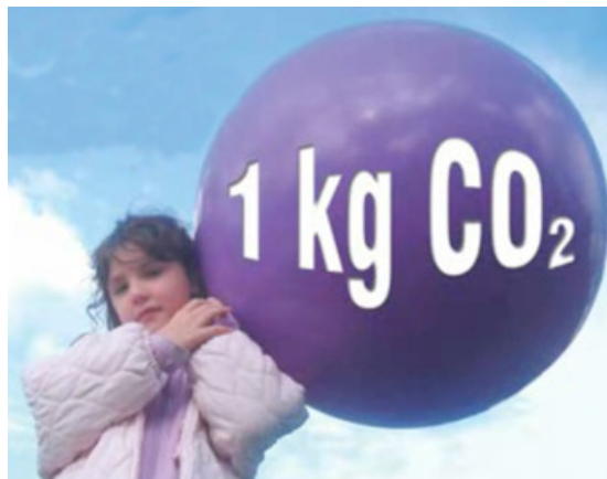
Ο όγκος που καταλαμβάνει 1 κιλό διοξειδίου του άνθρακα (CO 2 )

Ο ΣΥΝΔΕΣΜΟΣ ΕΤΑΙΡΙΩΝ ΦΩΤΟΒΟΛΤΑΪΚΩΝ ( www.helarco.gr ) είναι αστική μη κερδοσκοπική εταιρία που ιδρύθηκε το 2002 από τις σημαντικότερες εταιρίες που δραστηριοποιούνται στην παραγωγή εξοπλισμού, την εμπορία, εγκατάσταση και συντήρηση φωτοβολταϊκών συστημάτων . Εργάζεται για τη γοργή και ουσιαστική ανάπτυξη μιας υγιούς και βιώσιμης αγοράς φωτοβολταϊκών, τη θέσπιση των απαραίτητων κινήτρων και την άρση των εμποδίων που υπάρχουν σήμερα στην αξιοποίηση του εθνικού καυσίμου της χώρας, της ηλιακής ακτινοβολίας. Έχει συμβάλει τα μέγιστα στη θέσπιση εγγυημένων τιμών πώλησης της παραγόμενης ηλιακής ενέργειας (feed-in-tariffs), στη θέσπιση ειδικών κινήτρων για τα οικιακά φωτοβολταϊκά, στην προώθηση της αυτοπαραγωγής και της αποθήκευσης και στην απλοποίηση των διαδικασιών αδειοδότησης.